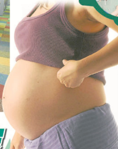
孕妇也是患上痔疮隐疾的高风险群之一。