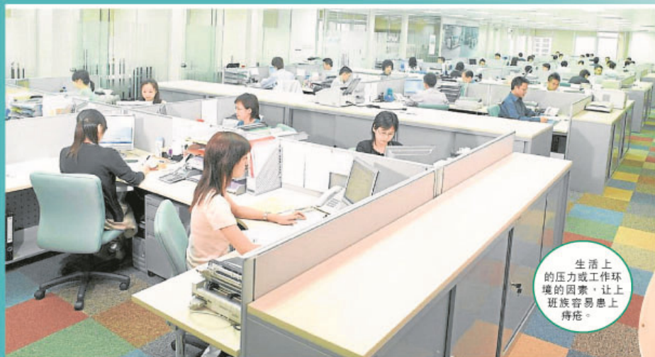
生活上的压力或工作环境的因素，让上班族容易患上痔疮。